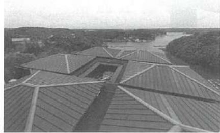
本館2階客室からの眺め。眼下に回廊でつながるヴィラタイプの客室があり、その向こうに英虞湾を望む。