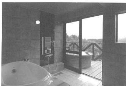
「ヴィラスイート」の浴室。全室に同様の内風呂と信楽焼の露天風呂を完備している。