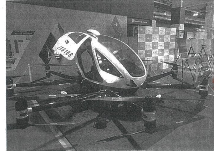
公開された空飛ぶクルマ＝東大大阪市

「HANAZONO EXPO」(花園エキスポ)で展示される「空飛ぶクルマ」が4日、報道陣に公開された。期間中、飛行はしませんが来場者は乗車を体験できる。 きょうから 花園エキスポ で、近未来の気分を楽しむことができる。花園エキスポは東大の花園中央公園で5、6の両日、開催。約200のブースが展開する。空飛ぶクルマは8本のアームの先に