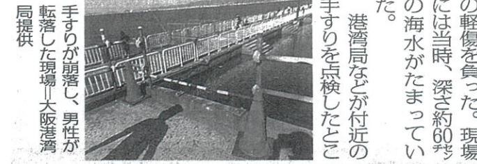
手すりが崩落し、男性が転落した現場

港湾局によると、男性は10月29日午前9時50分ごろ、釣り場に降りるためのスロープ付近で靴ひもを結び直