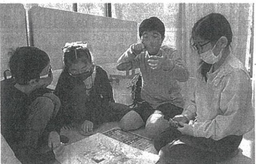
「未来の家」をテーマに話し合う児童ら＝和歌山県橋本市さつき台1で

堺・美木多小児童が見学 未来の暮らしについて考えようと、堺市立美木多小の5年生129人が4日、住宅メーカーの大倉(大阪市北区)が開発したニュータウン「さつき台」(和歌山県橋本市)を訪れ、