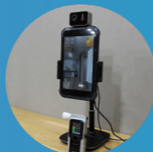
卓上型タイプもごさいます