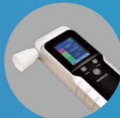
高精度の電気化学式アルコールチェッカー